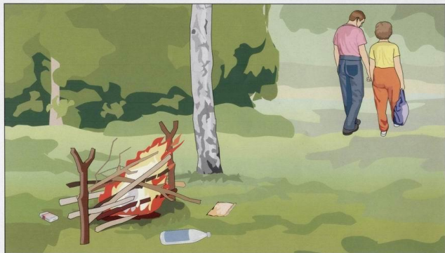
Разведение костров, поджигание сухой травы (палы)